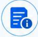
Table of Contents